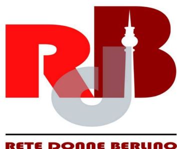
ILLUSTRAZIONE DI GIULIA FILIPPI

"Ad ogni incontro con la primavera Non so stare quieta – sorge il desiderio Antico, di un'ansia mista ad un'attesa Una promessa di bellezza E una gara con tutto il mio essere, con qualcosa che in essa si nasconde. Quando la primavera svanisce V'è il rimorso di non averla guardata abbastanza."